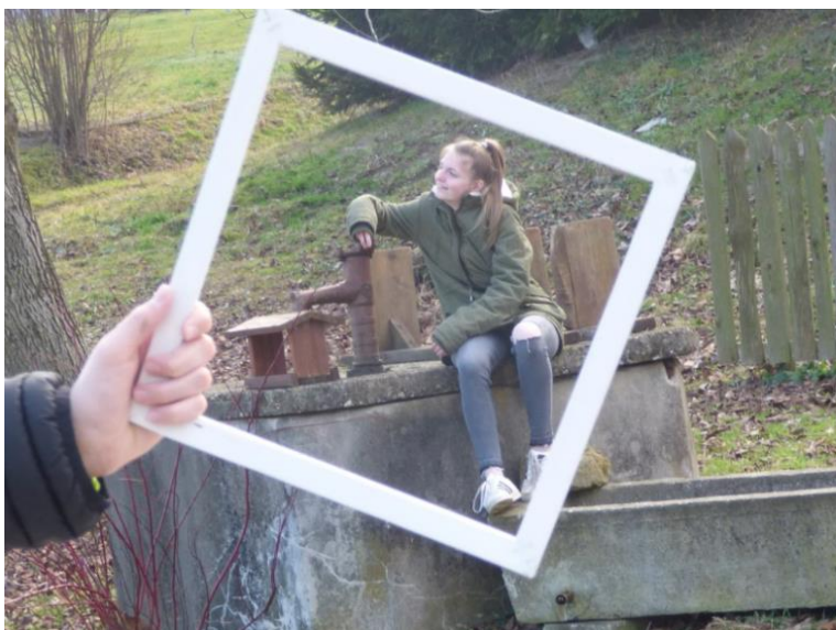
Slika 17: Zmagovalna fotografija natečaja

Mehko, čisto in dišeče, je bilo perilo iz vreče, a po kakšnem tednu dni, čisto vse se spremeni.