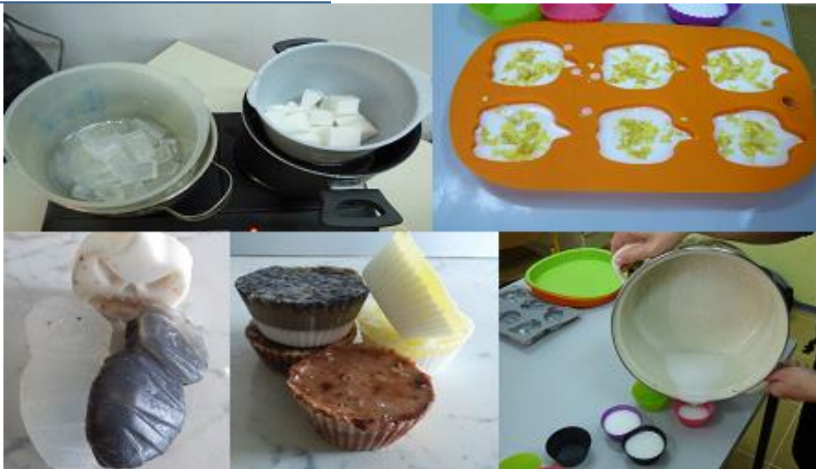
Slika 10: Prikaz izdelave naravnih mil