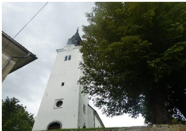
Slika 1: Cerkev sv. Mihaela

Župna cerkev sv. Mihaela je prvič omenjena 1252. Prvotno je bila skoraj v celoti zgrajena iz rimskih kamnov. Leta 1374 so jo gotsko prezidali in ji v 18. stol. dali baročno podobo. Prvotni ostanki so vidni le še v severni in južni steni. Cerkev je obokana in opremljena z baročnimi oltarji. Ob cerkvi so postavljeni na ogled številni rimski marmorni kamni, ki so bili vrnjeni iz Avstrije, kamor so jih Nemci med vojno odpeljali. Danes so razpostavljeni pod cerkvenim obzidjem in predstavljajo izvrstno zbirko fragmentov iz rimske dobe.