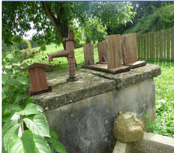
Slika 4 in slika 5: Vaško perišče na Črešnjevcu