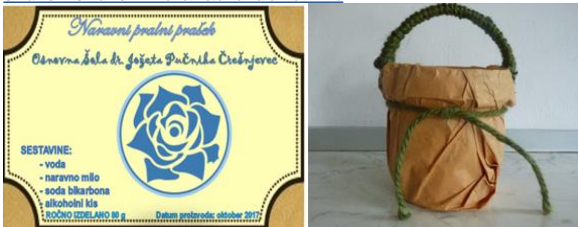
Slika 15 in Slika 16: Primer etikete na naravnem milu

Raziskali smo tudi posledice uporabe umetnih detergentov na okolje. Ugotovili smo, da uporaba teh detergentov močno onesnažuje okolje, prav tako je neprimerna za našo kožo. Takšen turistični produkt smo vključili tudi v turistično tržnico v okviru festivala Turizmu pomaga lastna glava.